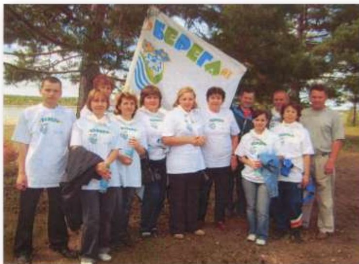
в экологической акции «Оберегай»,