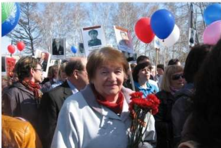
в шествии «Бессмертного полка»,